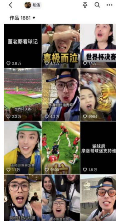
图1-2 Nuno同学、董老斯、山羊君