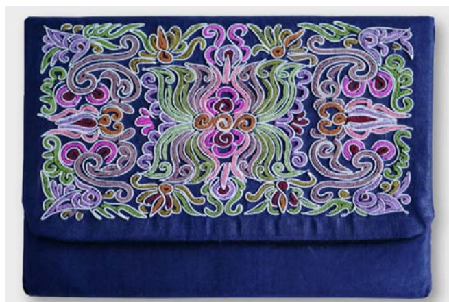
图3 ipad收纳包