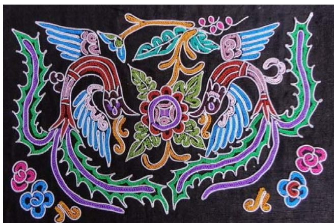
图1 孔雀纹

传说,在远古时代,水族的先祖们,还没有办法种田,只能以打鱼为食。正是因为鱼的存在,才养活了祖先,才有了后世的水族人民,可以说,是鱼给了他们生命。在水族古歌中,有一首“在老家,随地撒网,吃鱼虾,怀念故乡”的诗句,深刻地表达出了水族人民对鱼的万分感激和崇敬之情。除此之外,鱼类还具有繁殖力,因此,鱼类也被认为是多子多福的象征,这一切都是人们所期待的。