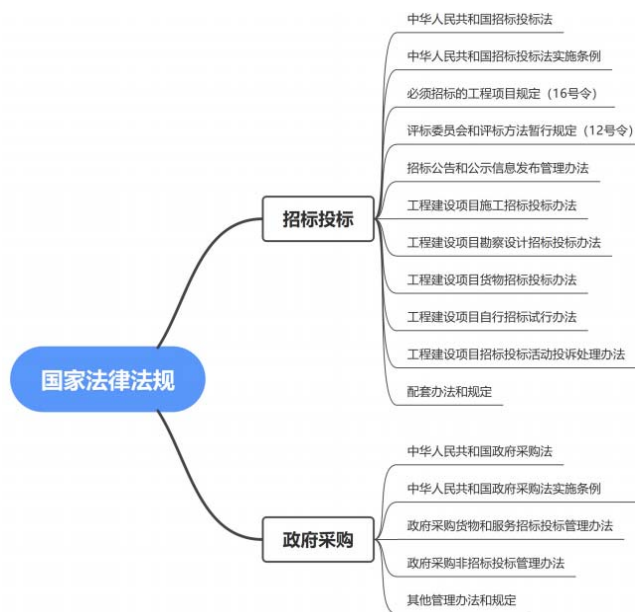
图2-1 采购领域涉及法律法规

遵循法律法规:企业应严格遵守国家相关的法律法规,确保非招标采购活动在合法、合规的前提下进行。在国家法律层面对于非招标采购方式管理可借鉴招标投标法、政府采购法及配套法律法规,参见图2-1。