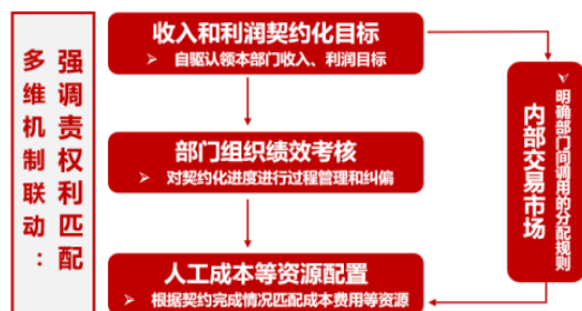
图1 多维机制闭环管理

多维机制打破预算“紧箍咒”，以业务部门负责人自驱认领收入和利润的契约化目标作为切入点，建立内部交易市场机制明确业务部门间调用自研产品或能力清单项目的收入和利润分配规则，通过组织绩效考核“指挥棒”对各部门收入和利润的契约化进度进行过程管理和纠偏，结合各部门收入和利润契约化的完成情况动态配置人工成本和研发费用等主要资源，将各个部门“责、权、利”统一起来，激发组织活力与干部员工的内生动力，激励各部门提质增效，共同做大做强企业业务规模。